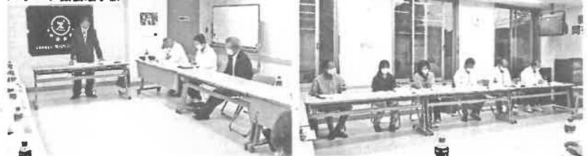
スポーツ協会理事会